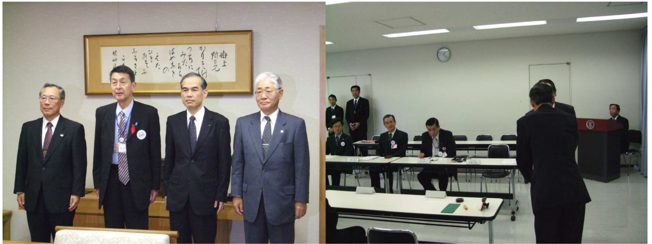
平成 21 年 10 月 30 日 新潟市役所にて災害協定